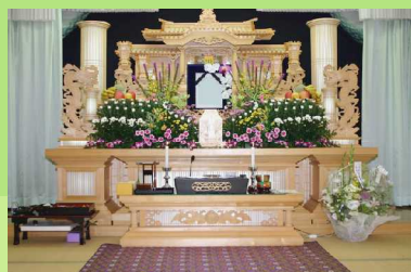
1階祭壇飾り付け例