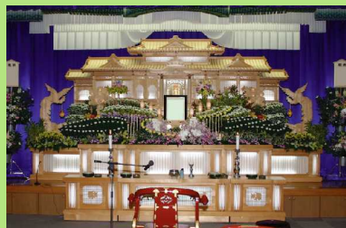
2階祭壇飾り付け例

幅広い要求にお答え出来る斎場です。 大切なひとときをお過ごしいただくために、 益城会館のご利用は、 一日一組に限らせていただいています。 他の方に気兼ねなくご利用になれます。