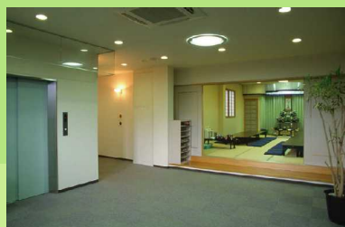
2階エレベーターホール