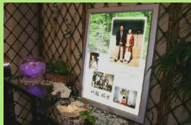
メッセージボード